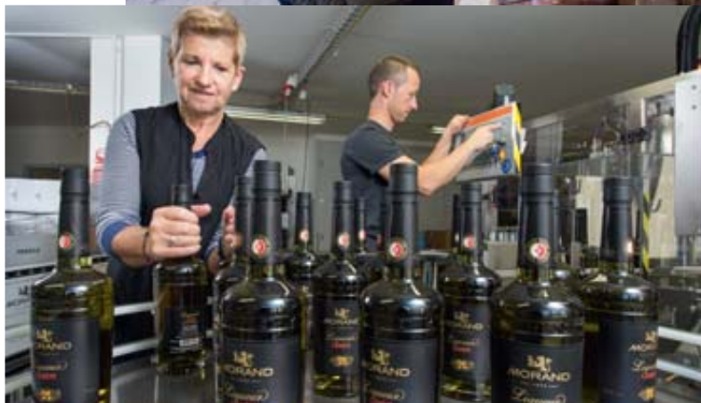
Le génépi valaisan s'exporte encore peu, à part à l'unité dans les valises des touristes.